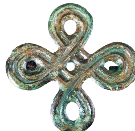
Bronzefibula aus dem 9. Jahrhundert aus der Umgebung von Memel (heute Klaipėda in Litauen)

Für die Anbindung an den Fernhandel sprechen auch Münzen, darunter viele Dirhams, Silberlinge aus dem Arabischen Weltreich. Sie werfen ein Licht auf ein anderes Geschäftsfeld der aus Schweden kommenden Wikinger, die auch die Elite der benachbarten Kiewer Rus stellten, des ersten Großreichs in Russland: den Sklavenhandel. Zahlreiche Funde zeigen, dass die Nordmänner den Fluss Memel als Einfallstor ins litauische Hinterland nutzten.