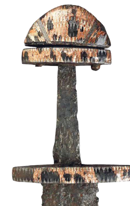
Schwert (10. Jahrhundert) aus dem Wikingerfriedhof von Wiskiauten im Samland