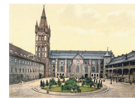
Das Schloss war ein Wahrzeichen Königsbergs. Ende des Zweiten Weltkriegs wurde es zerstört

Einer ihrer Stützpunkte lag bei Wiskiauten am Rand des Samlands. Stücke aus der Prussia-Sammlung und neue Grabuntersuchungen belegen, dass hier offensichtlich Wikinger und Pruzzen eine friedliche Koexistenz pflegten. Die Grabungen wurden zwischen 2005 und 2011 von den Schleswig-Holsteinischen Museen und der Russischen Akademie der Wissenschaften in Moskau unternommen und zeigen, welche Zusammenarbeit seinerzeit möglich war.